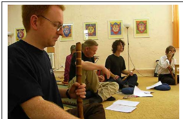
レッスン風景 ペイン

その日、ヨガに参加できなかったのは、私だけだったようだ。ヨガのクラスは、ホテルから2軒目にあるヨガ・スクールで、エイジェイ・ボベイドが教えてくれた。ここは、尺八サマースクールの会場にもなっている。