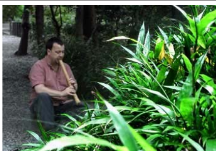
大仏に捧げる尺八演奏